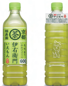
● 第60回ジャパンパッケージングコンペティション 経済産業大臣賞 ● 日本パッケージデザイン大賞2021 大賞 (サントリー緑茶 伊右衛門600mlペット ラベルレス) 株式会社サントリー

パッケージというデザイン領域のプロフェッショナルが集い、作品のデザイン性や創造性を競うコンペティションです。生産や流通を支える包装資材としての面だけでなく、デザイン的な価値や、商品づくりの観点にも重きを置きながら、パッケージデザイナーの目で評価することが、大きな特徴となっています。