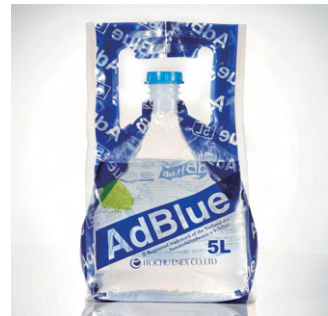
● 第60回ジャパンパッケージングコンペティション 経済産業大臣賞 高品質尿素水 AdBlue®(アドブルー®)5ℓ 共同印刷株式会社