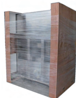
● 2021日本パッケージングコンテスト 経済産業大臣賞 (大型装置の国内輸送用梱包材開発) 株式会社日立物流