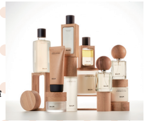
日本パッケージデザイン大賞 (BAUM) 資生堂

パッケージというデザイン領域のプロフェッショナルが集い、作品のデザイン性や創造性を競うコンペティションです。生産や流通、環境などの包装材料としての面だけでなく、デザイン的な価値や、商品づくりの観点にも重きを置きながら、パッケージデザイナーの目で評価することも、大きな特徴となっています。