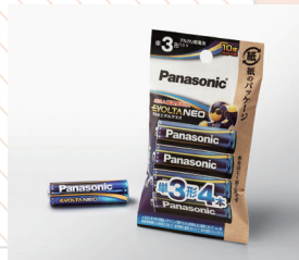
経済産業大臣賞 〔乾電池エボルタ・エボルタネオシリーズ エシカルパッケージ〕 パナソニック エナジー株式会社