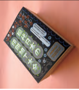
『デザインの新常識50』グラフィック社/2023

編集プロダクション、出版社を経て、2005年にグラフィック社入社。2007年「デザインの新常識」を創刊する。デザイン・印刷・紙関連書籍、また「柚木沙弥郎のことば」、画集「ヒグチユウコ画集CIRCUS」、画集「宇野亞喜良(Kaleidoscope)」などの本の企画・編集している。