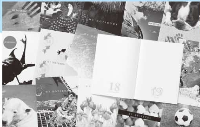
昨年の例。今年も新デザインの表紙を用意しています。

参加方法：各回開始前にプロローグ展示ゾーンの会場にお集まりください。 予約の必要はありません。