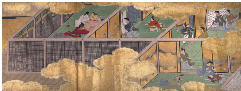
盛安本源氏物語絵巻 夕顔断簡 1650年代 個人蔵(フランス)

日本では江戸期から本格化する印刷出版が、古典の伝統をつなぐ大切な役割を果たしました。たとえば『源氏物語』。平安盛期に紫式部が書きのこしたこのテキストは、原本が霧散した後も学者らによる校訂校閲が繰り返され、中世のあいだ数系統の手書き写本が書きのこされます。絵巻、能、源氏絵、奈良絵本への展開をみながら、江戸に華ひらく出版文化により、武家から町人まで広く『源氏物語』をたのしむ時代がやってきたのです。今回、ギリシャ・ローマ古典を再発見したヨーロッパの文化運動ルネサンスに例えて、‘和書ルネサンス’とよんでみることにしました。古典文学と印刷出版の関わりを、三部構成で検証してまいります。