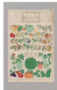
教育版画(博物図) 1873年