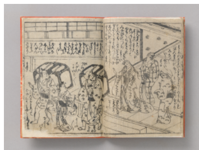
赤本『したきれ雀』 1737年以降 実践女子大学図書館蔵