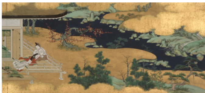
重要文化財 盛安本源氏物語絵巻 未摘花上巻 1650年代 大本山 石山寺蔵 (公開期間:4月17日-5月9日)