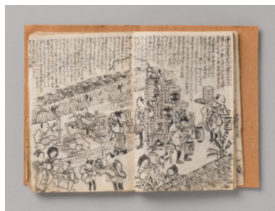
大晦日曙草紙 稿本 1839年以前