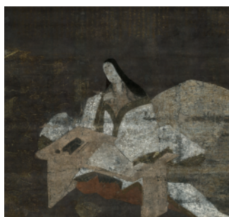
紫式部聖像 室町前期 大本山 石山寺蔵