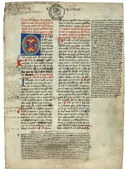
アリストテレス『自然誌および天体論』（写本） 13世紀末—14世紀初／ヴァチカン教皇庁図書館蔵 Pal. Lat. 1033, f.1r