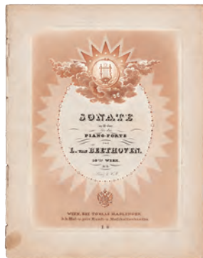
ベートーヴェン『ピアノ・ソナタ第7番 宮沢賢治『春と修羅』1924年／印刷博物館蔵 二長調 Op.10-3』1798年以降／印刷博物館蔵