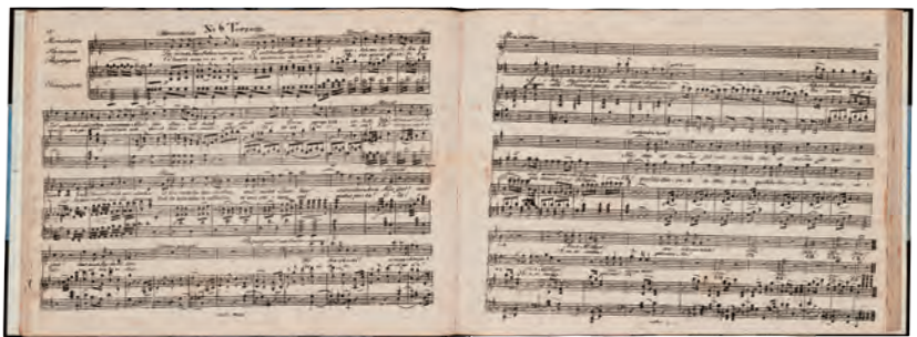
モーツァルト『魔笛』1805年頃／印刷博物館蔵