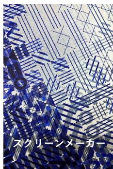
スクリーンメーカー

今年のグラフィックトライアルでは、作品制作の中で数多くの新しい表現技術が試され、そして誕生しました。網点の形を変える「スクリーンメーカー」をはじめ、オフセット印刷でホログラムを再現した「オフセットホロ」、繊細な水滴を印刷で再現した「結露印刷」など、多彩な印刷表現をご覧ください。