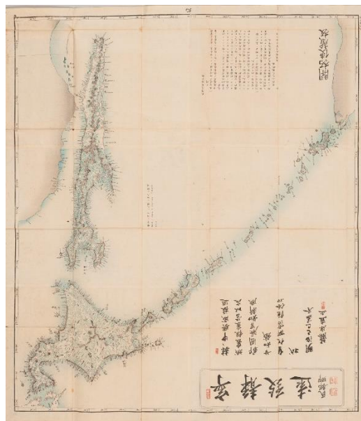
「北海道国郡図」 1869(明治2年)