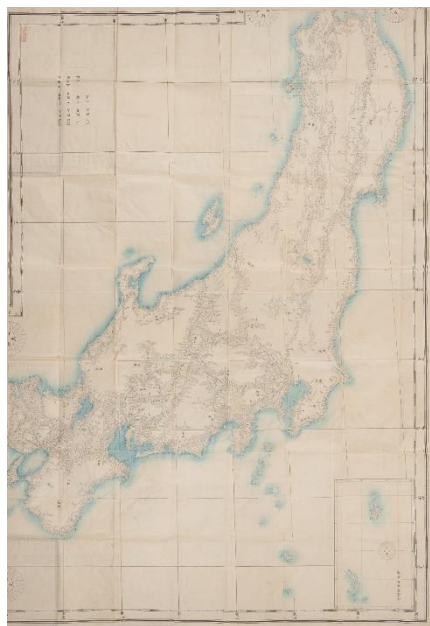
「官板実測日本地図」より畿内東海東山北陸 伊能忠敬作 慶応期(1865~1867年)刊

ロシアの南下政策が進み、西洋列強も日本と接触を試みようとする中で、幕府は海防意識を強め、世界と日本が急速に接近していきます。松平定信は寛政の改革で『三国通覧図説』などを絶版にし、取締りを強化する一方で、西洋の情報にも熱いまなざしを向けていました。伊能忠敬は日本初の実測日本地図(伊能図)をつくりましたが、その出来映えが正確だったため、機密情報とされました。しかし、その忠敬の地図の情報が国外に伝わり、日本には印刷物として逆輸入されました。その正確さは近代へと引き継がれ地図づくりの礎となり、活用され続けていきました。