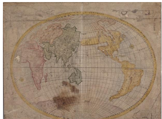
「地球隋円図」司馬江漢