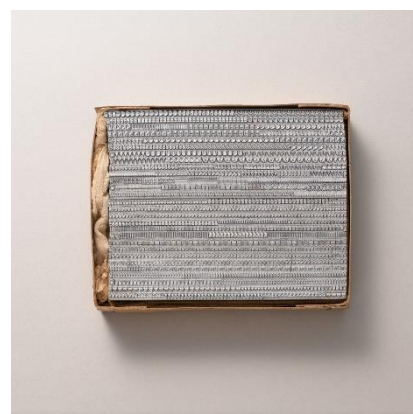
欧文活字のフォント

活字の製造を支えた機械と、その機械から生み出された欧文活字を展示します。活版印刷産業は、1920～30 年代の機械工業化とともに、アメリカとイギリスを中心に急成長を遂げました。量産された金属活字を並べた様子は、まるで銀河のようです。