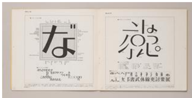
『TYPO 1』 1970年

写真植字によって生み出された文字は、それまでの活字とは違い物理的な制約がなく、自由に貼り合わせてレイアウトすることが可能でした。新しい時代の新しい表現が実現したのです。