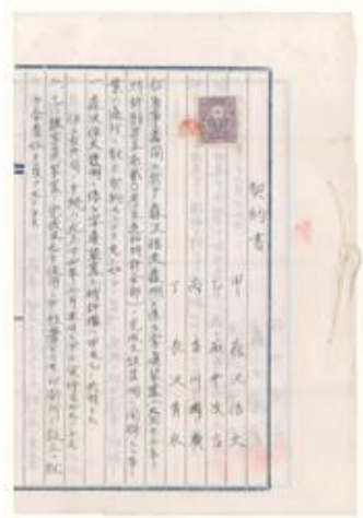
契約書 1925年

活版印刷は、文字数の多い日本語において大量の金属活字を必要とし、その多くの文字の中から必要な活字を選び出すという煩雑な作業を伴うものでした。1枚の文字盤から様々な文字を作り出せる写真植字は画期的で、日本語には最適な技術だったのです。