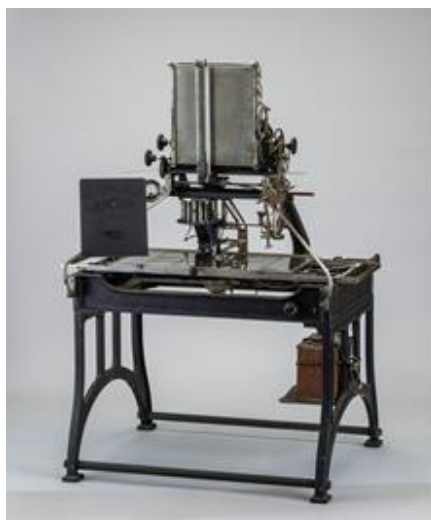
初期の実用機 1935年頃 (株式会社写研 蔵)

写真植字のしくみとその機器の開発はどのようにすすめられたのか、機種開発の歴史、部品や文字盤製造の変化をみていきます。