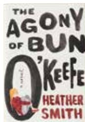
[カナダ] Heather Smith 著 「The Agony of Bun O'Keefe (バン・オキーフの嘆き)」 Penguin Teen Canada 発行 Jennifer Griffiths デザイン 2017アルクイン/サエティ・ブックデザイン コンクール 散文・フィクション部門1位受賞