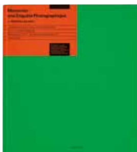
[ベネズエラ] Mathieu Aselin 著 「Monsanto®: Une enquête photographique Investigation (モンサント: 写真による調査)」 Actes Sud 発行 Ricardo Báez デザイン 2018世界で最も美しい本コンクール栄誉賞