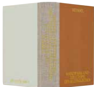
[スイス] Uta Hassler 著 「HEIMAT, HANDWERK UND DIE UTOPIE DES ALLTÄGLICHEN (郷土、手仕事、 日常的なものへのユートピア)」 Hirmer 発行 HUBERTUS デザイン 2018世界で最も美しい本コンクール金の活字賞