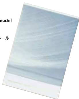
[日本] 「池内晶子 | Akiko Ikeuchi」 gallery21yo-j 発行 小池俊起 デザイン 第52回造本装幀コンクール 文部科学大臣賞