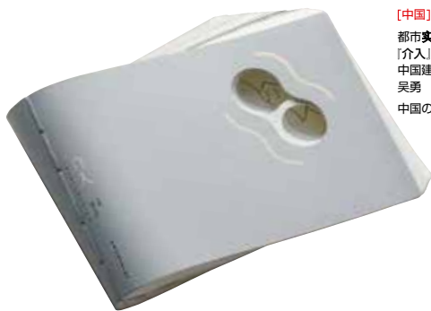
[中国] 都市実践、吳勇 著 「介入」 中国建筑工业出版社 発行 吳勇 デザイン 中国の最も美しい本コンクール2017入賞

*発行数等が少ない等の理由で入手困難な本があるため、受賞作すべての展示ではありません。