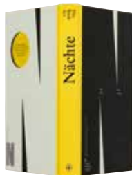
[ドイツ] Klaus Beyer, Oliver Götze, Helmut Gold 他 著 「Das Buch der Nächte (夜の本)」 Verlag Hermann Schmidt 発行 HDW - Neue Kommunikation デザイン ドイツの最も美しい本コンクール 2018入賞