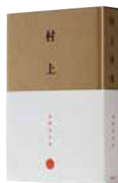
[日本] 西野嘉章 著 「村上善一玄々とした精神の深みに」 玄風舎、東京大学総合研究博物館 「インターメディアテック」発行 西野嘉章+山本浩貴 デザイン 第52回造本装幀コンクール 経済産業大臣賞